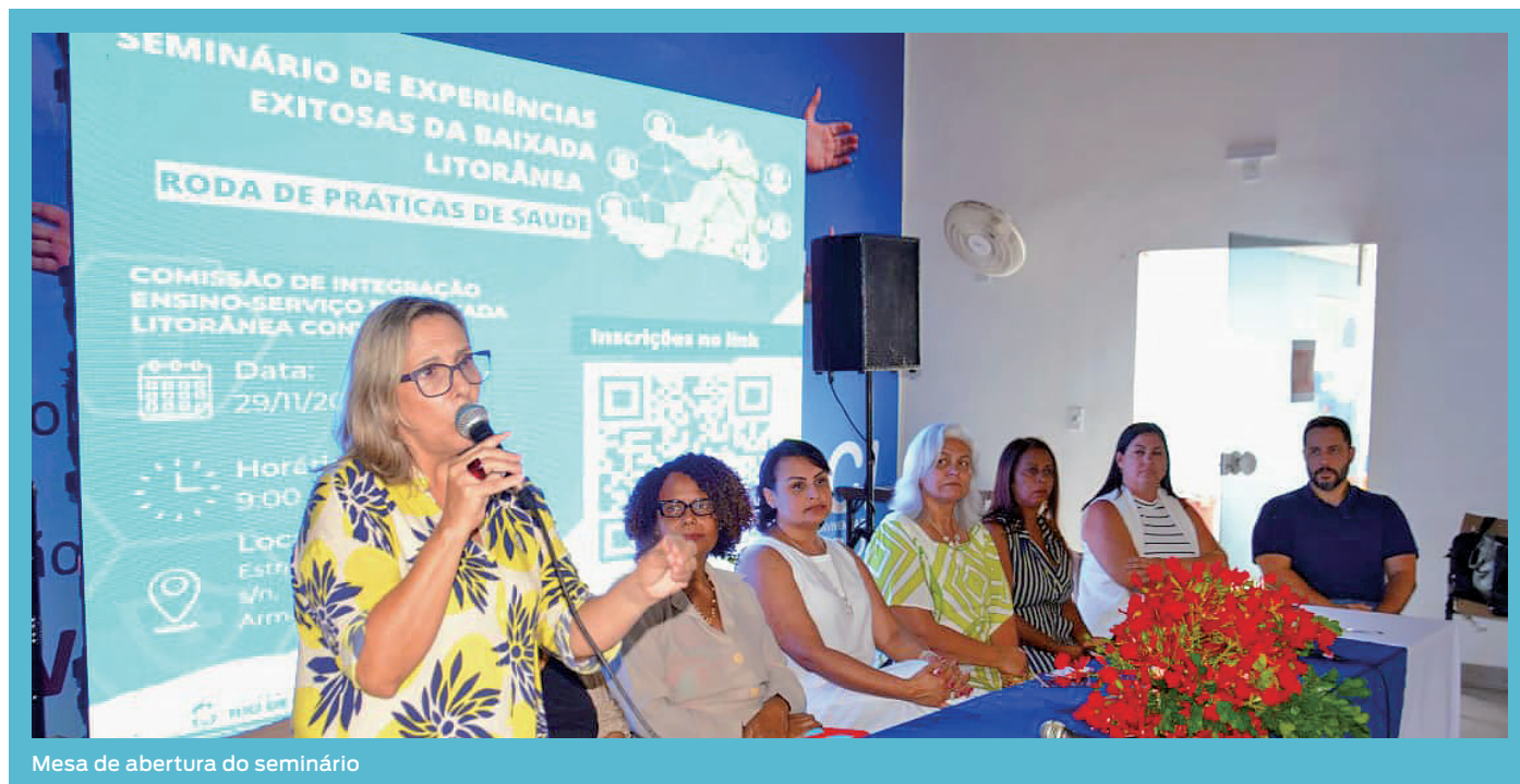
Mesa de abertura do seminário

Todos os trabalhos inscritos foram previamente analisados e selecionados pela comissão composta por representante da CIES-BL, do IdeiaSUS – Fiocruz, do COSEMS-RJ e do apoio técnico da COOEP/SES-RJ. A região contou com a apresentação de trabalhos de oito dos seus nove municípios, com temas de saúde pública da região. Vale ressaltar ainda, como um dos critérios do regulamento desse seminário, que os municípios de Arraial do Cabo e São Pedro da Aldeia tiveram seus trabalhos previamente aprovados, pois foram selecionados também para a 3ª Mostra Estadual de Práticas de Saúde COSEMS RJ – IdeiaSUS de 2023.