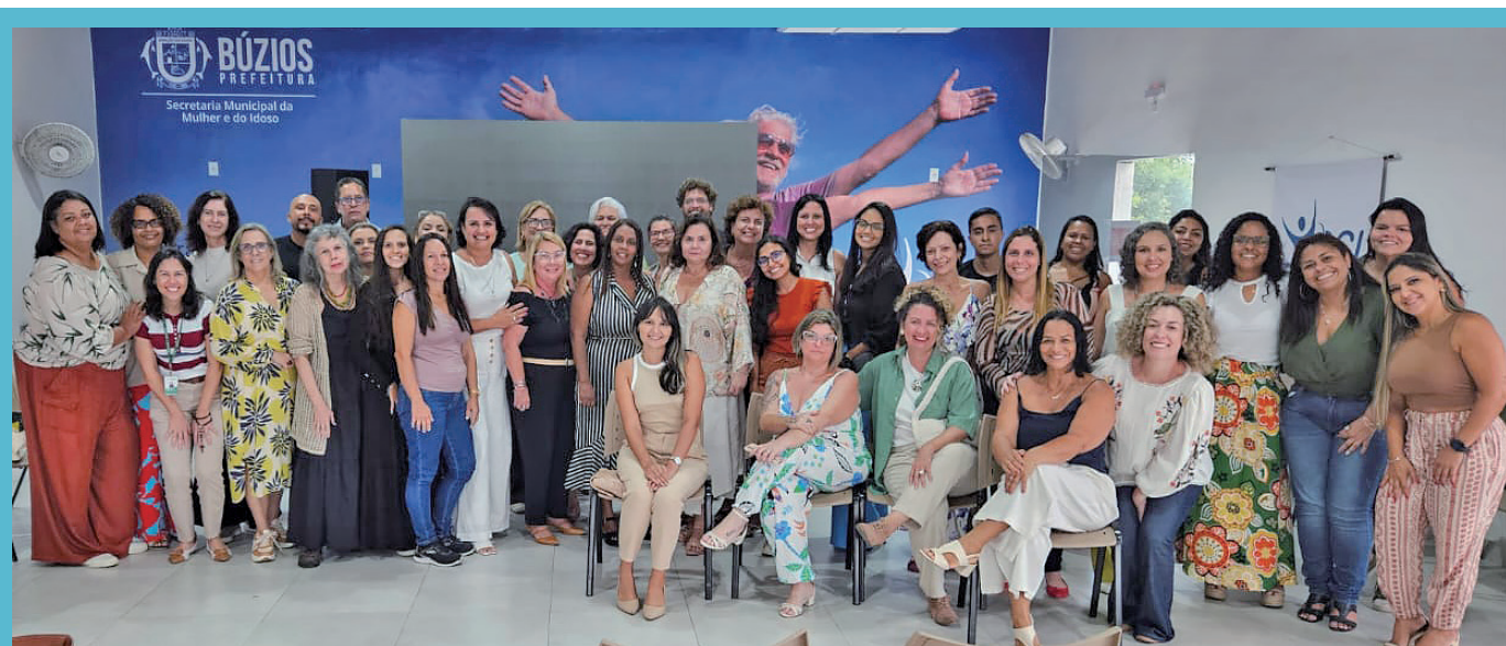
Seminário de Experiências Exitosas da Baixada Litorânea

Foi realizado, no dia 29 de novembro de 2023, o “Seminário de Experiências Exitosas da Baixada Litorânea – Rodas de Práticas de Saúde COSEMS RJ/ ideiaSUS – Fiocruz”, no município de Armação dos Búzios, cumprindo assim mais uma ação do Plano de Educação Permanente em Saúde de 2023. Participaram os representantes da Comissão Permanente de Integração Ensino-Serviço (CIES) da Baixada Litorânea, representantes do apoio técnico da Coordenação de Educação Permanente (COOEP/SES-RJ), representantes da Comissão Intergestores Regional (CIR/SES-RJ) e representantes da Atenção Primária em Saúde da região.