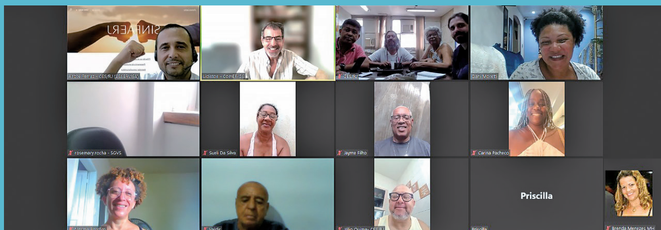
Reunião da Comissão Organizadora no dia 23/02/2024

Composição aprovada em reunião da Comissão Executiva do CES-RJ, no dia 06/02/2024 e na reunião Plenária do dia 20/02/2023.