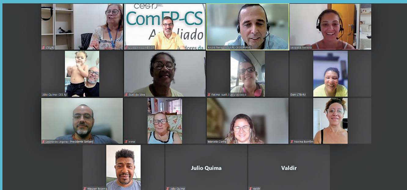
Reunião da Comissão Organizadora no dia 01/03/2024