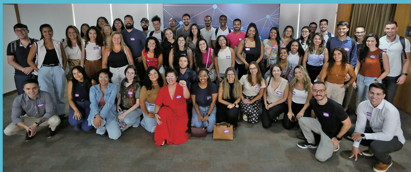
Residentes médicos e multiprofissionais em saúde

A Secretaria de Estado de Saúde recepcionou no dia 1º de março de 2024 os residentes médicos e multiprofissionais em saúde que farão sua formação em unidades hospitalares da rede estadual.