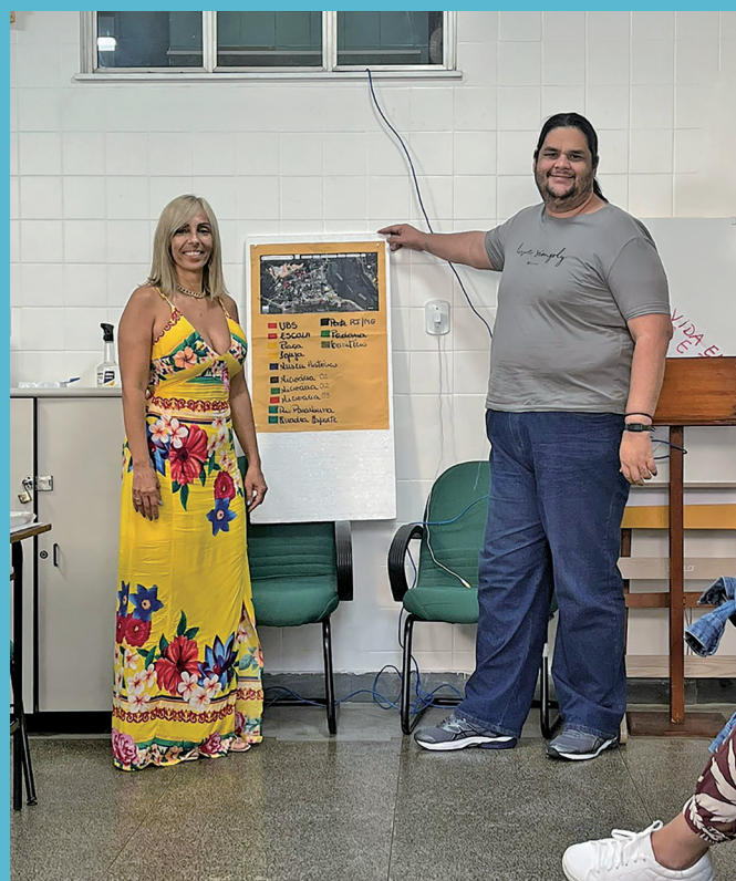
Atividades em grupo da última qualificação para agente comunitário em Saúde